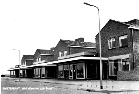
SWIFTERBANT, Winkelcentrum 'de Paart'