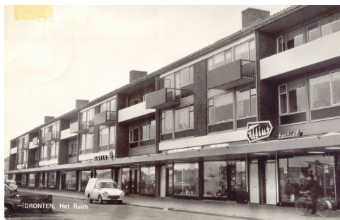
DRONTEN, Het Ruim

Hiernaast zie je vier foto's. Het zijn de drie winkelcentra uit Biddinghuizen, Swifterbant en Dronten. Probeer eens te achterhalen welk winkelcentrum bij welk dorp hoort.