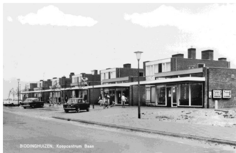
BIDDINGHUIZEN, Koopcentrum 'Beem'