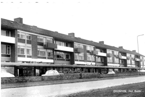
DRONTEN, Het Ruim