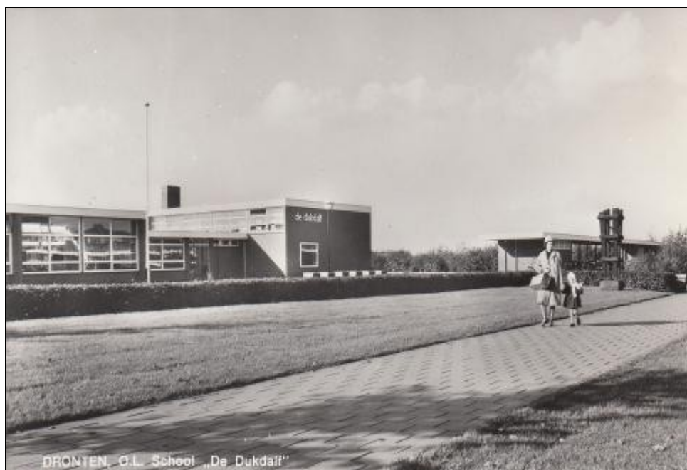
DRONTEN, O.L. School „De Dukdaal“