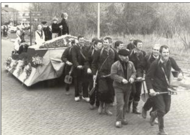
Optocht in Swifterbant op koninginnedag

Net zoals in Wissekerke werd men ook in Swifterbant maatschappelijk actief. De eerste verenigingen waren al opgericht, zoals de Vereniging voor Dorpsbelangen, Swift 64, de muziekvereniging, het zangkoor Echo der Golven, de Toneelvereniging Markanti, enz. Maar een voorziening