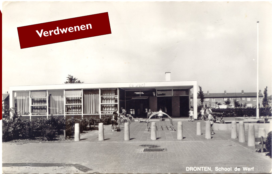
Kleuterschool de Werf

Uit de tijd dat er nog aparte kleuterscholen en lagere scholen bestonden. Hier de openbare kleuterschool De Werf. Met de invoering van de basisschool dienden alle voormalige kleuterscholen op te gaan in een basisschool. De Werf ging samen met De Uiter-ton. Het gebouw kwam leeg te staan en werd later gesloopt. Waar eerst kinderen speelden is het appartementencomplex De Werf gebouwd. De naam is bewaard gebleven. Niet alleen heeft het nieuwe woonoord deze naam overgenomen, ook de aula van De Uiter-ton heet nu De Werf.