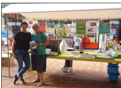
In augustus was de Stichting Geschiedschrijving op de Meerpaaldagen met een fraai ingerichte stand aanwezig

Van Wil Hertong ontvingen wij deze foto. Ze toont een houten woning zoals er zoveel in de polder bij de kampen werden gebouwd. Deze woning stond in Roggebotsluis. Op de zijgevel ervan valt op het straatnaambordje Tussenweg te lezen.